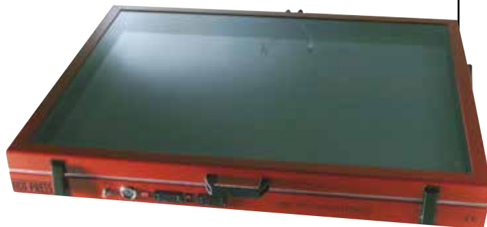
Presă Vacuum "Hot Glass Vacuum Press"

Capacul presei este format din două foi de sticlă armată. Placa de jos conține un film conductiv transparent care generează căldură în interiorul presei. Un termostat digital conectat la placă este utilizat pentru a controla și monitoriza temperatura. Presă este echipată cu un temporizator electronic pentru a seta temperatura dorită și pentru a opri automat presă. Capacul transparent vă permite să verificați vizual interiorul presei în timpul diferitelor etape de procesare.